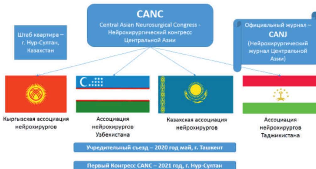
Рисунок 5 – Нейрохирургический конгресс Центральной Азии

повышением квалификации специалистов и обменом опытом. Следующим шагом в данном направлении является создание объединения «Нейрохирургический конгресс Центральной Азии», в состав которого войдут члены Казахской ассоциации нейрохирургов, Ассоциаций нейрохирургов Кыргызстана, Узбекистана и Таджикистана (рис. 5). Штаб-квартира международной ассоциации будет находиться в г. Нур-Султан.