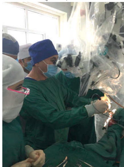
Рисунок 4 – профессор Акшулаков С.К. во время проведения операции на базе Республиканской клинической больницы Караболо

Профессор Акшулаков С.К. провел показательные операции (мастер-класс) на базе Республиканской клинической больницы Караболо по удалению менингиомы средней трети фалькса справа 58-летней женщине и трансназальное удаление гигантской кистозной краниофарингиомы ребенку 12-ти лет. Кроме того, были проконсультированы 12 пациентов с различными нейрохирургическими патологиями (рис. 4).